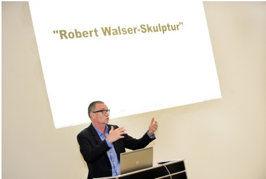
Robert Walser ist eines von Thomas Hirschhorns Idolen.

Mit einem Jahr Verspätung: Der Künstler Thomas Hirschhorn darf nun doch noch seine Robert-Walser-Skulptur auf dem Bieler Bahnhofplatz aufstellen.